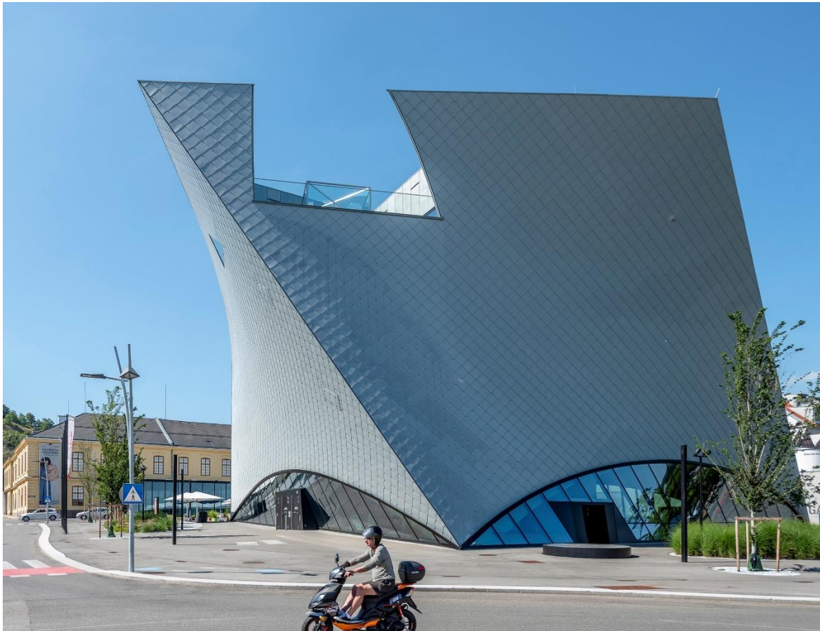
Landesgalerie Niederösterreich, 2021