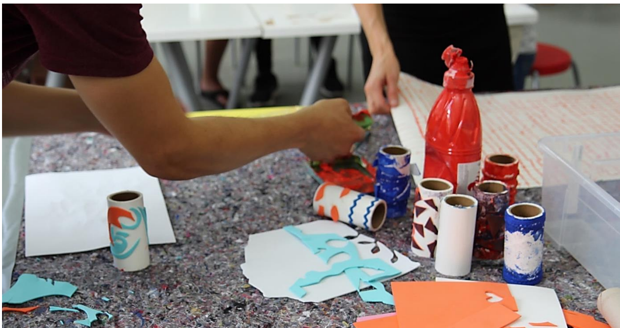
Blick ins Atelier: Family Factory September 2018

Überlege dir, wie dein Muster aussehen soll und schneide entsprechende Figuren und Formen aus Moosgummi oder Karton aus. Beklebe deine ganze Rolle.